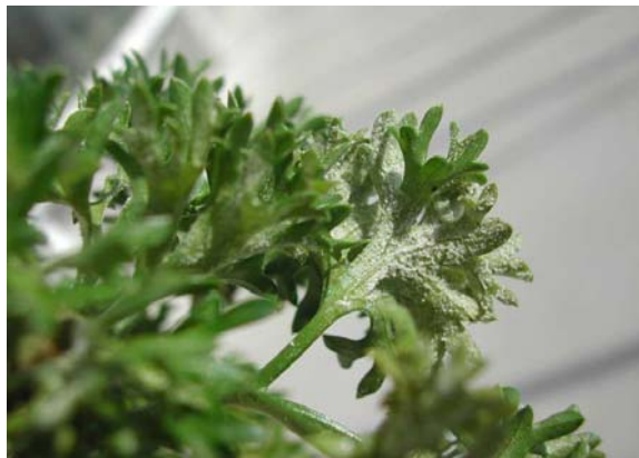
Figuur 3 en 4. Valse meeldauw op platte en krulpeterselie.