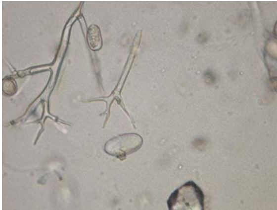
Figuur 1. Grote sporangia van krulpeterselie.