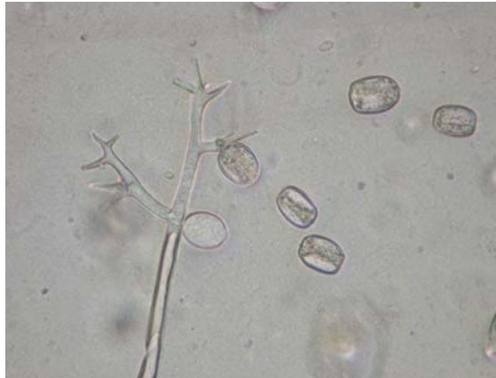
Figuur 2. Kleinere sporangia van platte peterselie.

Dit vond plaats op 19 september. In een bruto rand met niet geoogste (krul)peterselie werd, in duplo, een vierkante meter met valse meeldauw uit krulpeterselie en met valse meeldauw uit platte peterselie geïnfecteerd. Om de besmettingskans (door vocht en temperatuur) te verbeteren werd iedere geïnfecteerde vierkante meter een vijftal dagen met plastic afgedekt. In de rest van de proef, waarin na de vierde oogst op 5 september de objectbehandelingen reeds gespoten waren en er weer enige hergroei zichtbaar was, werd de helft (twee stroken van 1½ meter over de lengte van het proefveld) van iedere herhaling met een valse meeldauw sporensuspensie van krulpeterselie geïnfecteerd.