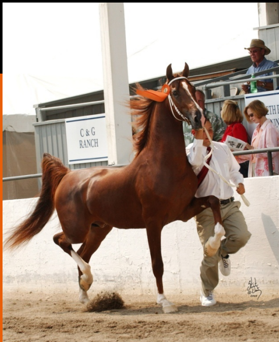
A New Day (ASB x (TP))