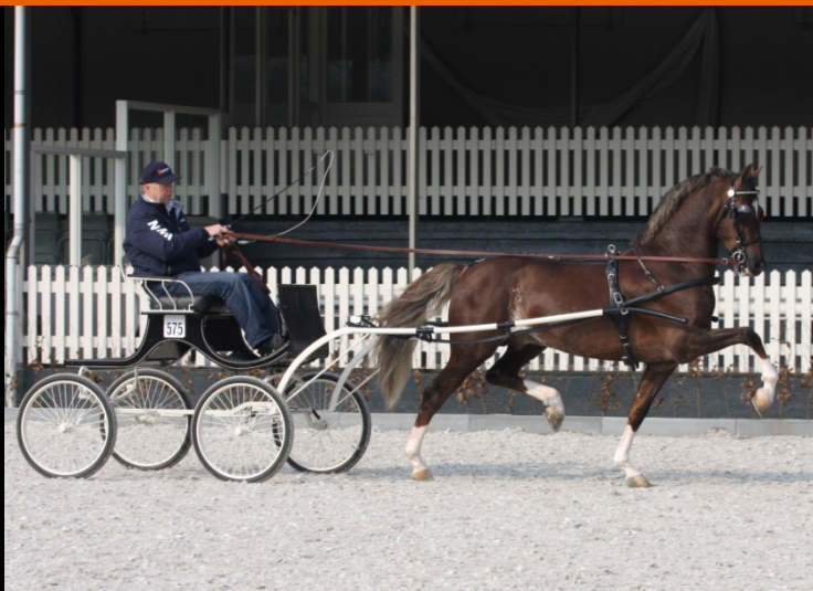
Morocco Field Marshall