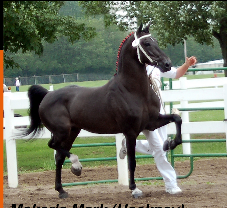
Maker's Mark (Hackney)