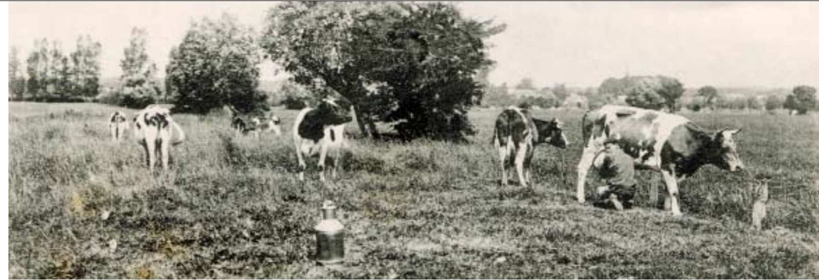
Vooral de kleine bedrijfjes in de oostelijke zandprovincies kregen het moeilijk in de crisis van de jaren dertig. De crisiswet leverde hen weinig voordeel op

Landbouwcrises lieten diepe sporen na, maar de koe kwam er sterker uit