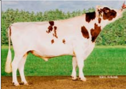
BEUKENHOF 346 IDEAL (TALENT X LIGHTNING)