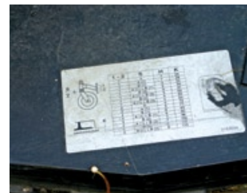
De tabel voor de instellingen van de maaihoogte is op het maaidek geplakt.