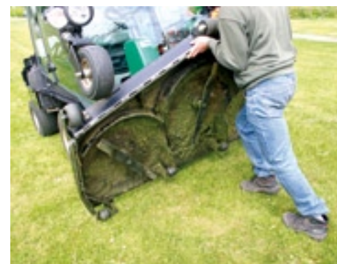
Om onderhoud onder het maaidek te plegen, kun je deze bijna 90 graden omhoogklappen.