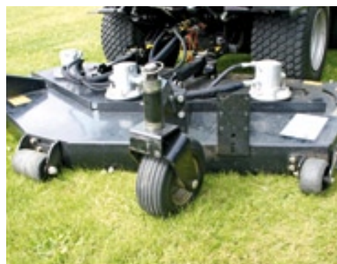
Twee zwenkwielen en zeven anti-scalpeurrollen op het maaidek zorgen voor een stabiele loop.

zowel voor de dagelijkse punten, zoals het motoroliepeil en luchtfilter, als voor de andere onderdelen, zoals het vervangen van een oliefilter. ■