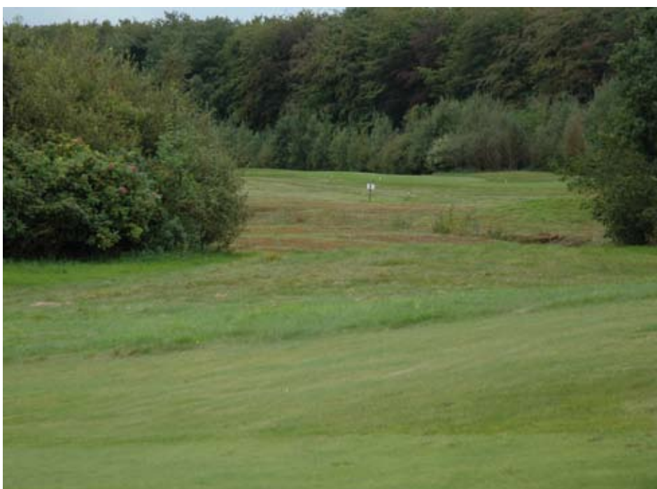
De natuur op een golfbaan in Friesland.

Nederland telt 16 CtG-gecertificeerde golfbanen. Er kan meer toegevoegde waarde gegeven worden aan de CtG-certificering, CtG dient als merk gepromoot te worden. Een gecertificeerde van het eerste uur vindt pleit voor: meer professionaliteit in het CtG-systeem door gebruik te maken van ervaren auditors en het beter promoten van CtG banen. Hij stelt het vrijwillige karakter ter discussie omdat dit vrijblijvendheid in de hand werkt. Werk aan de winkel dus voor NGA, NVG of de NGF, wie van de drie zal het initiatief voor CtG nemen?