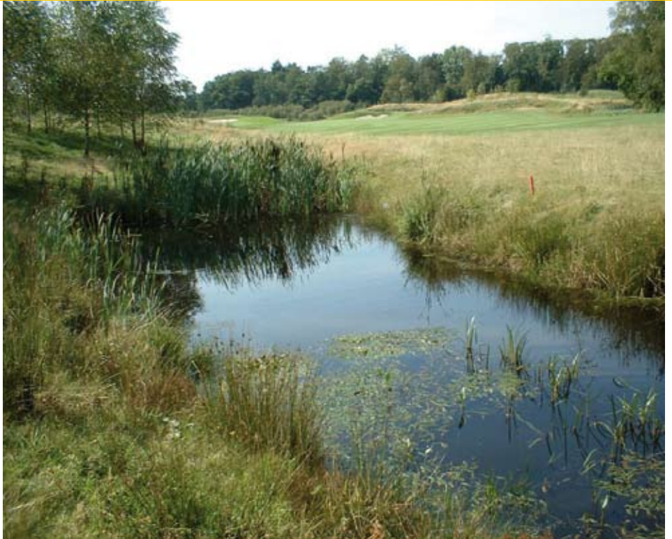
Natuurschoon op Golfbaan Lage Vuursche.