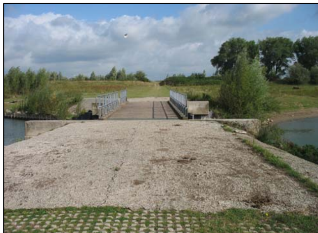
Erosie van toegangsweg en brug bij Gameren na aanleg (2000) en verbeteringsmaatregelen (2005).