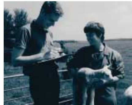
Beoordeling herstel oorwond