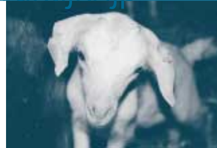
Lam met regulier en elektronisch oormerk

Schuur- en schaafplekken, welke ontstaan als gevolg van druk van de rand van het oormerk op de oorhuid, nemen in de loop van het onderzoek af van 16 % na 1 maand tot 6,6 % aan het eind. Deze plekken kunnen na genezing soms weer opnieuw ontstaan.