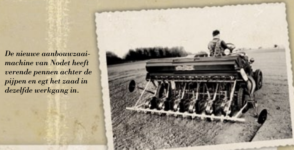
De nieuwe aanbouwzaaimachine van Nodet heeft verende pennen achter de pijpen en egt het zaad in dezelfde werkgang in.