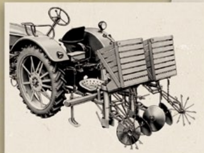
Stoll halfautomatische pootmachine.

4wd. De nieuwe Bautz 200 heeft 15 pk en een 8+2 transmissie. LandbouwMechanisatie schrijft: Onder de buik van de trekker is ruimschoots plaats voor verzorgingswerktuigen en maai balk. Hanomag toont drie nieuwe typen met de namen Greif, Brilliant en Robust. Hatz komt naar Keulen met de nieuwe TL 38, Deutz met de D25, D25S en D50.