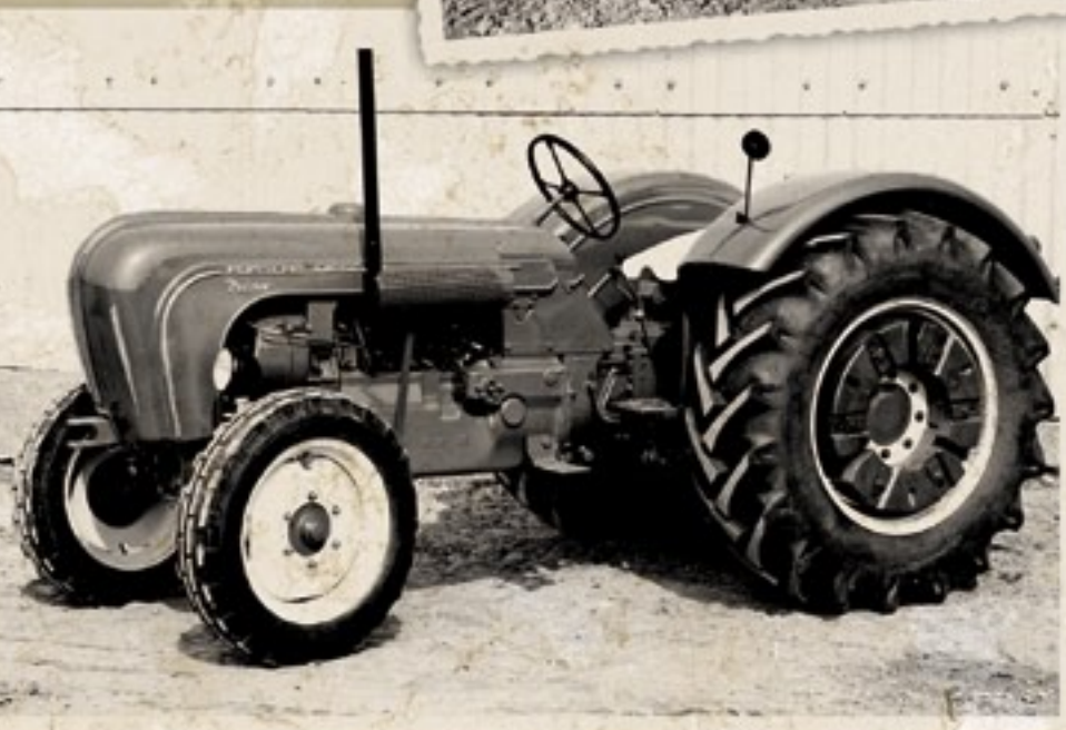
De Master van Porsche heeft een viercilindermotor met 50 pk, een 8+2 transmissie, een top van 20 km/h en weegt 2.100 kg.