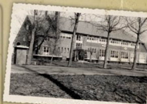
De Oostwaardhoeve is begin 1960 ruim tien jaar het proefbedrijf van het ILR (Instituut voor Landbouwtechniek en Rationalisatie). De redactie van Landbouwmechanisatie staat daar uitgebreid bij stil.

Wendt 17 voor nadere inlichtingen tot VELDKONINGS HANDELMIJ. N.V. BOERENHOFHEVEN (N.L.) Importeur voor geheel Nederland