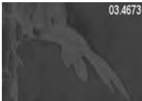
Fine droplet spraying.

Applying sufficient droplets to plant leaves in dense canopies is a well known problem in fieldspraying. Attempts to increase an overall coverage of droplets have been made for many years. Nevertheless practice shows increasing infections with plant pathogens like Phytophthora infestans , resulting in an increased use of chemicals. This is conflicting with the interest of farmers and conflicting with a common desire to grow agricultural products with reduced quantities of agrochemicals. So, what to do?