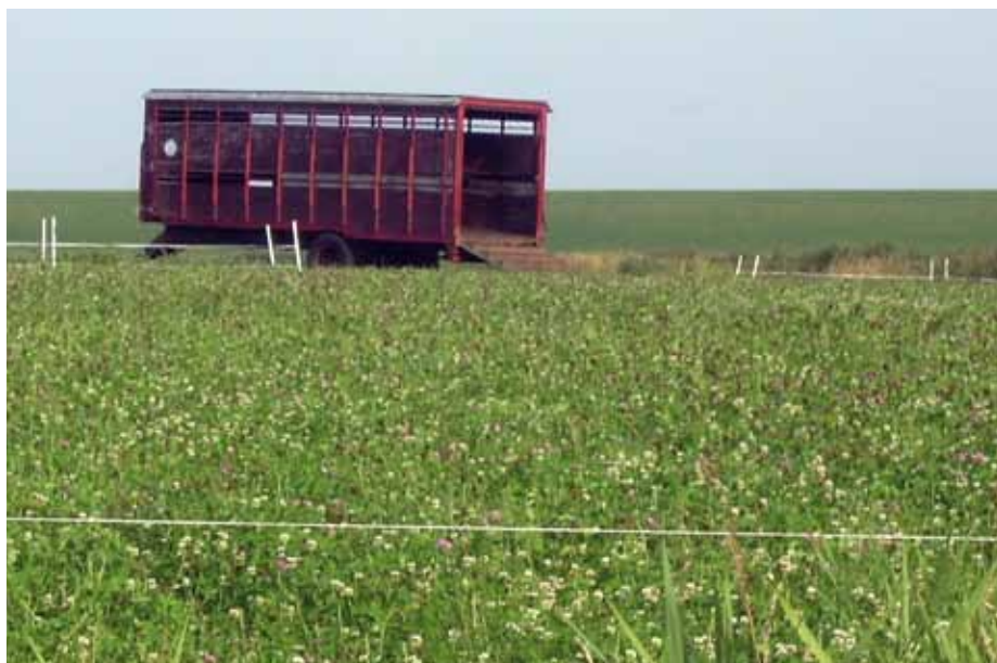
Een veewagen dient als nachtverblijf en schuilplaats

Op Gerbrande State hebben de 60-80 lammeren een veewagen ter beschikking als nachtverblijf en schuilplaats. Bij Tuenter hadden de 70 lammeren in 2009 beschikking over twee grote kadaverbakken (rundvee € 550,- per stuk). In de loop van de zomer werden deze te klein voor het aantal lammeren en stonden er lammeren buiten als het regende. Dit leek geen probleem en lokte zelfs andere lammeren naar buiten om ook met regen te gaan grazen. In 2009 hadden bij Wanders 35 lammeren een hok van 18 m 2 en in een andere wei hadden 40 lammeren de beschikking over een veewagen. In hetzelfde jaar heeft Jan Wanders ze twee weken in een wei gezet zonder nachtverblijf. Hij overweegt om een deel van de lammeren dag en nacht te laten grazen zonder nachtverblijf.