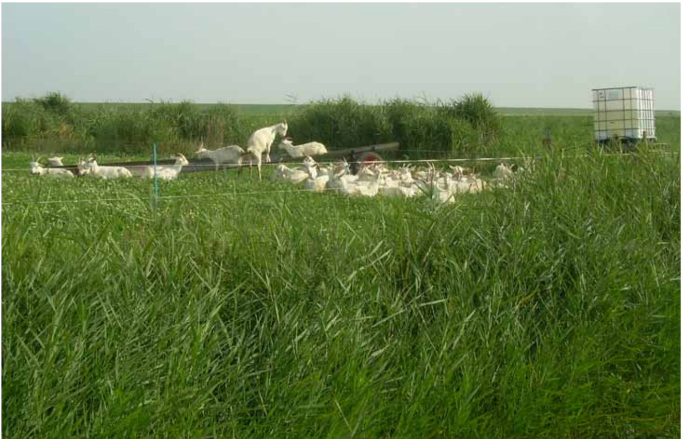
Als afrastering wordt er op Gerbrande State een dubbel elektriciteitsdraadje gespannen

in de overgangperiode van de stal naar de wei iets meer brok gevoerd worden (zie kader hierboven).