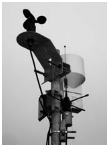
Weerpaal voor BOS.