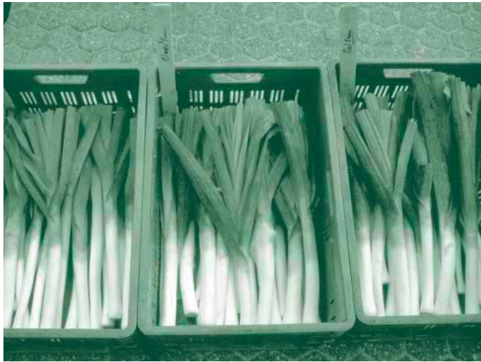
De kwaliteit van biologische prei heeft te lijden onder diverse aantastingen. In Meterik worden diverse rassen vergeleken op prestaties voor productie en kwaliteit in de biologische teelt

type gewassen relatief laag. Er zijn geen synthetische pesticiden of pesticiden van natuurlijke oorsprong ingezet, waardoor ook geen milieurisico's ontstaan. Bij het thema duurzaam beheer productiemiddelen ligt de fosfaat bodemreserve ver boven de streefwaarde, als gevolg van de voorgeschiedenis van dit perceel. Een snelle verlaging is op korte termijn niet mogelijk. Door het lage fosfaatoverschot wordt verdere groei van de bodemreserves voorkomen. Het aantal uren handwieden op bedrijfsniveau ligt met 33 uur/ha nog iets te hoog. Voor een voldoende bedrijfscontinuïteit in de toekomst zal deze arbeidsinzet verder verlaagd moeten worden. In figuur 1 en tabel 1 worden de resultaten van het biologisch bedrijf (1997 tot en met 2000) weergegeven.