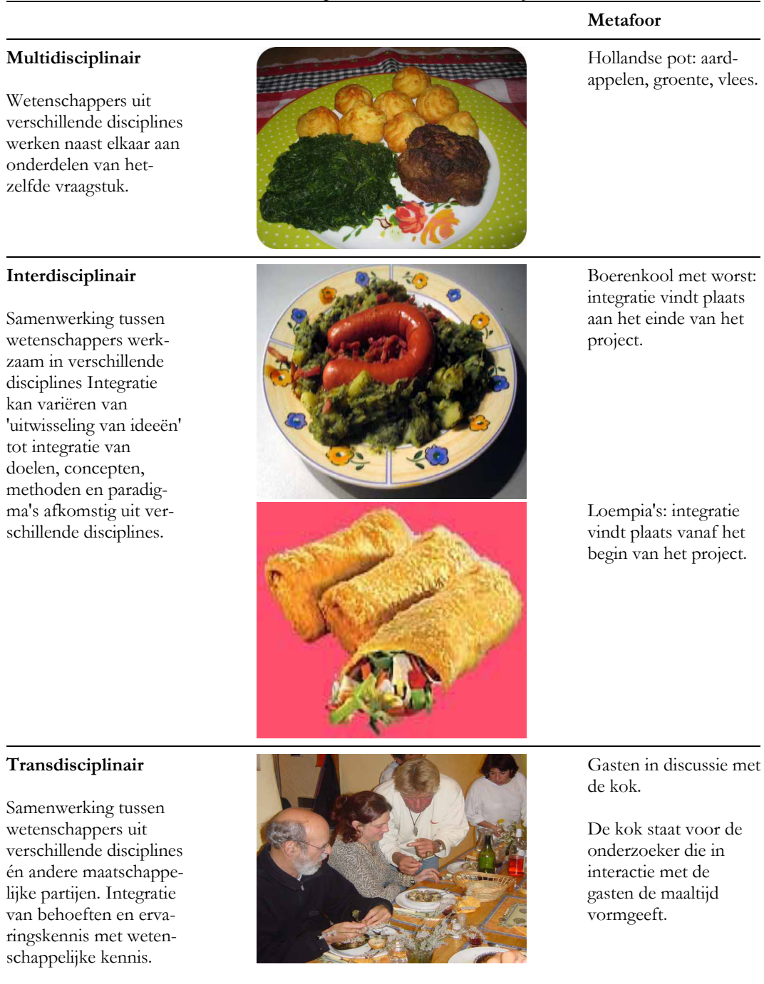
Tabel 2.2. De termen multi-, inter- en transdisciplinair vertaald naar een metafoor.

Er is dus een relatie tussen het gebruik van de termen en de kwaliteitscriteria die aan onderzoek worden gesteld; voor de één betekent monodisciplinariteit kwaliteit, en voor een ander staat het aanpakken van 'real time problems' en het betrekken van stakeholders voor kwaliteit van het onderzoek.