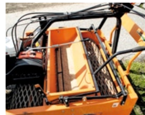
Een roerder in de zaadbak verdeelt het zaad gelijkmatig en voorkomt brugvorming.