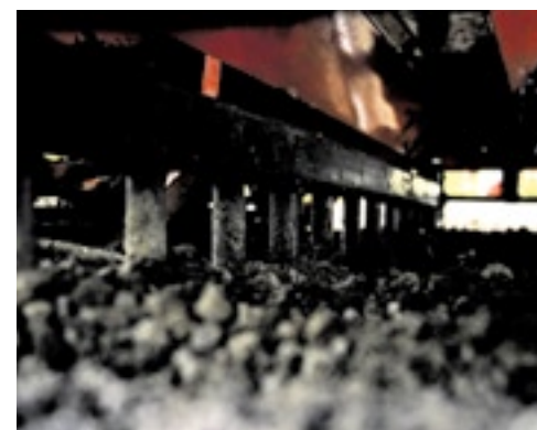
De schudeg zit onder de machine. Hiermee kun je prima egaliseren en het zaad inwerken.