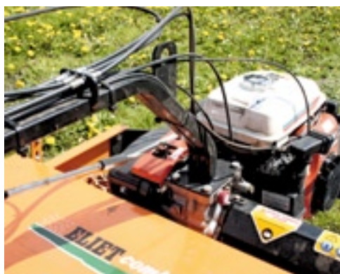
Een versnelling kiezen doe je met de lange hendel.