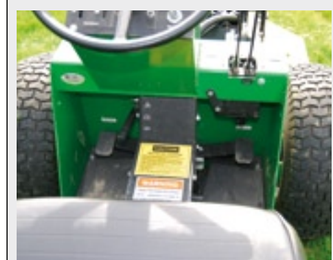
Rechts zit een rijpedaal voor vooruit, links een pedaal voor achteruit.