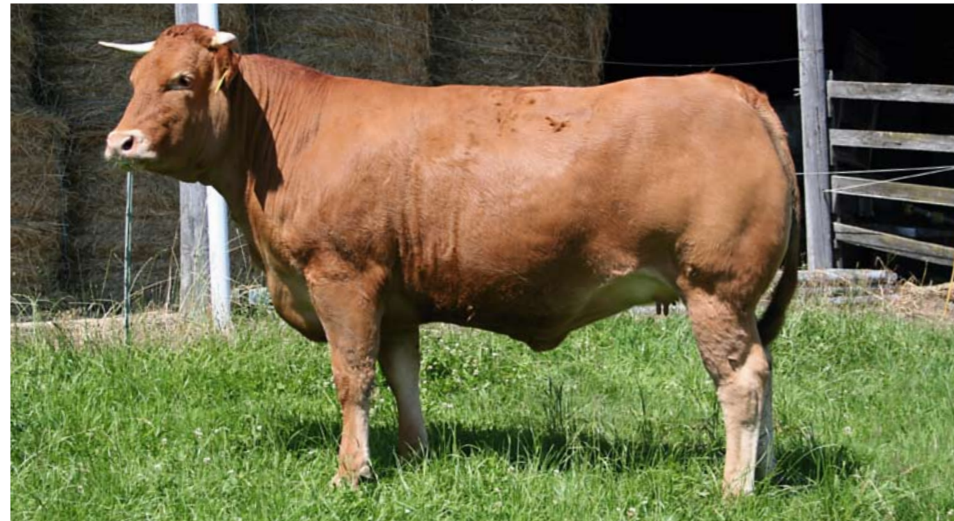
Qua uiterlijke bouw vererft Urville in vrouwelijke lijn eerder iets compactere dieren

IFNais: fokwaarde op basis van nakomelingenonderzoek in het veld QMS: fokkerij-index (basis: prestaties vrouwelijke nakomelingen uit proefperiode op het selectiestation) JBS: vleesproductie-index (basis: prestaties mannelijke nakomelingen uit proefperiode op het selectiestation) IBOVAL: fokwaarden op basis van nakomelingenonderzoek in het veld bij geboorte en op speenleeftijd (fokperiode) bron: ITEB/INRA, Parijs 03/2010