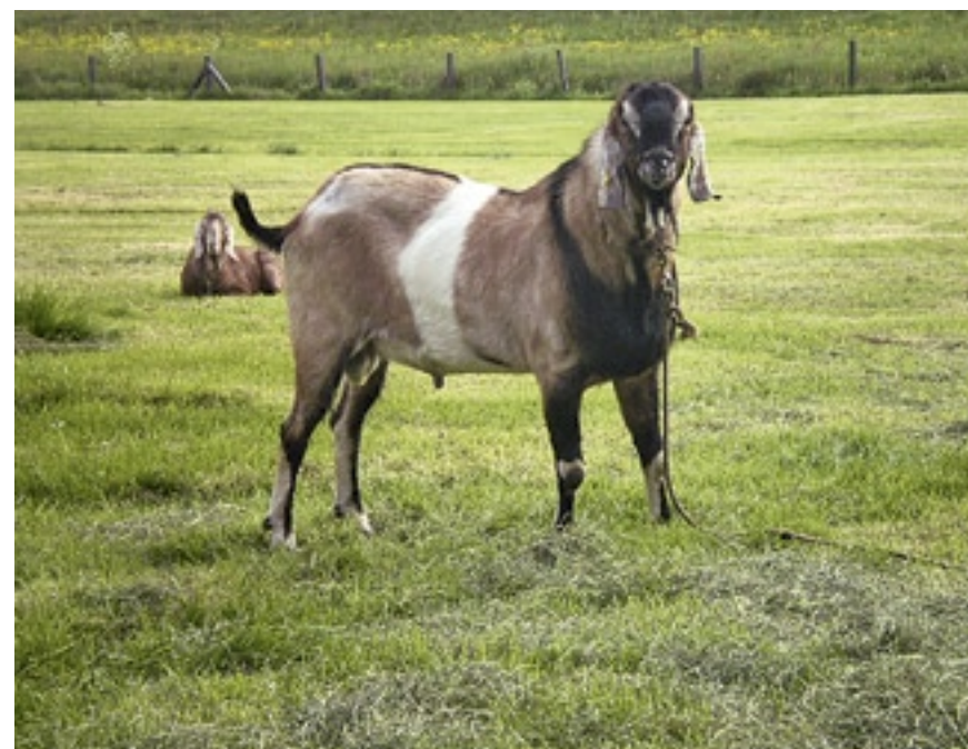
Sunshine Roderick was in 2008 en in 2009 reservekampioen van de oudere bokken op de landelijke Nubische keuring in Kootwijkerbroek.