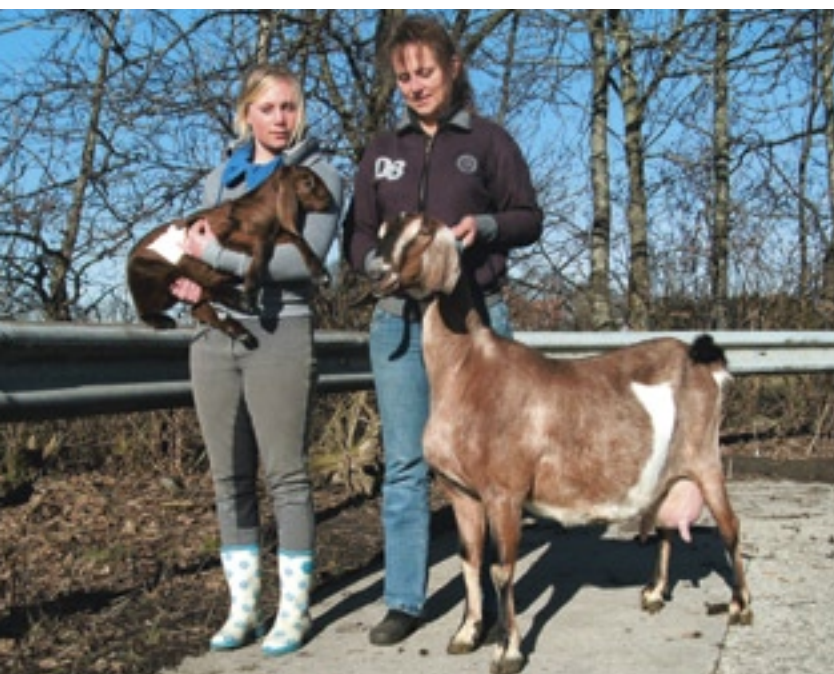
Sunshine Samantha was in 2009 de beste melkproducerende geit en stond als eerste in de top tien van Nubische productiegeiten.