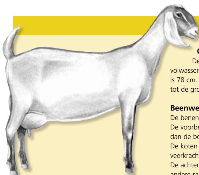
Het True Type van de Nubische geit.