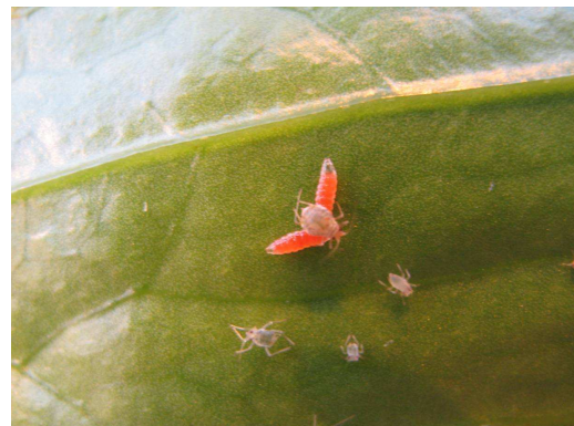
Figuur 4: Galmug Aphidoletes aphidimyza ruimt bladluis schoon op