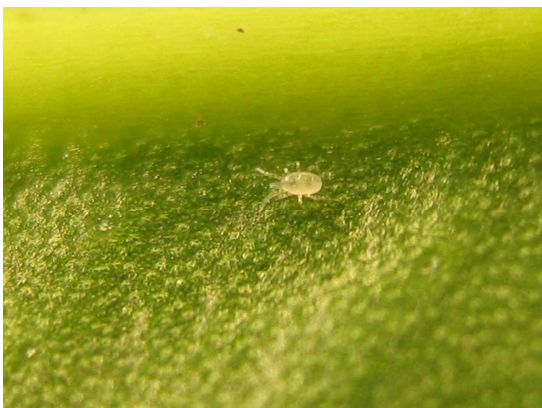
Figuur 2: roofmijt op Anthurium blad