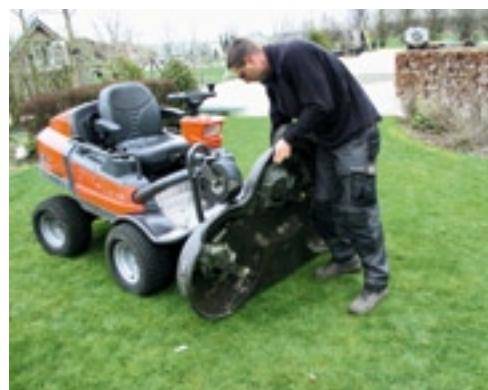
Het maaidek opklappen voor onderhoud gaat eenvoudig.