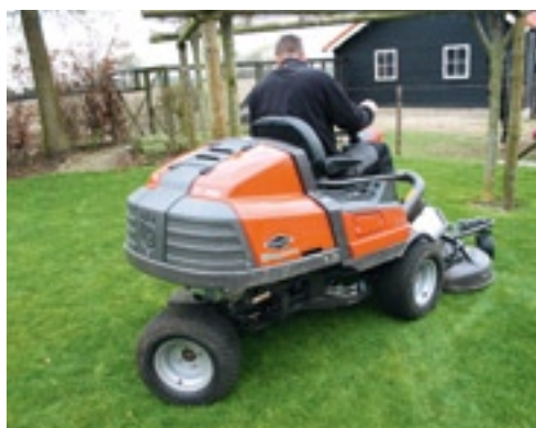
Doordat de achteras knikt, kun je zeer kort om een boom maaien.

as uit elkaar schuift. Laat je het dek weer neer, dan dien je de vloerplaat onder het stuur te verwijderen om de aftakas weer in elkaar te schuiven. ■