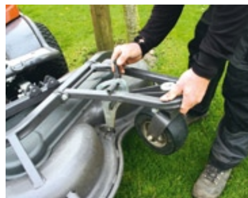
De maaihogte instellen doe je door een bout los te draaien en de stelwielen te verzetten.