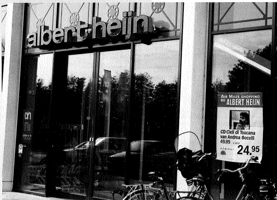
De Nederlandse deelnemers aan EurepGAP, AH en Laurus, vertegenwoordigen 45 % van de Nederlandse supermarkten

Onder druk van maatschappelijke ontwikkelingen vindt in de landbouw een geleidelijke omschakeling plaats van een aanbodgerichte naar een vraaggerichte productie. Hierbij neemt de wens om te komen tot een meer maatschappelijk gewenste productiewijze toe. Naast zichtbare kwaliteit in de supermarkt speelt ook de productiewijze een grote rol. Daarbij wenst de consument meer informatie over de herkomst en veiligheid van het voedsel. Mede door recente incidenten rondom voedselveiligheid zal de consument steeds hogere eisen stellen aan het voedsel zelf en aan de informatie erover. EurepGAP is een kwaliteitssysteem ontstaan uit toenemend maatschappelijk belang voor voedselveiligheid en voor een verantwoorde productie, herkomst