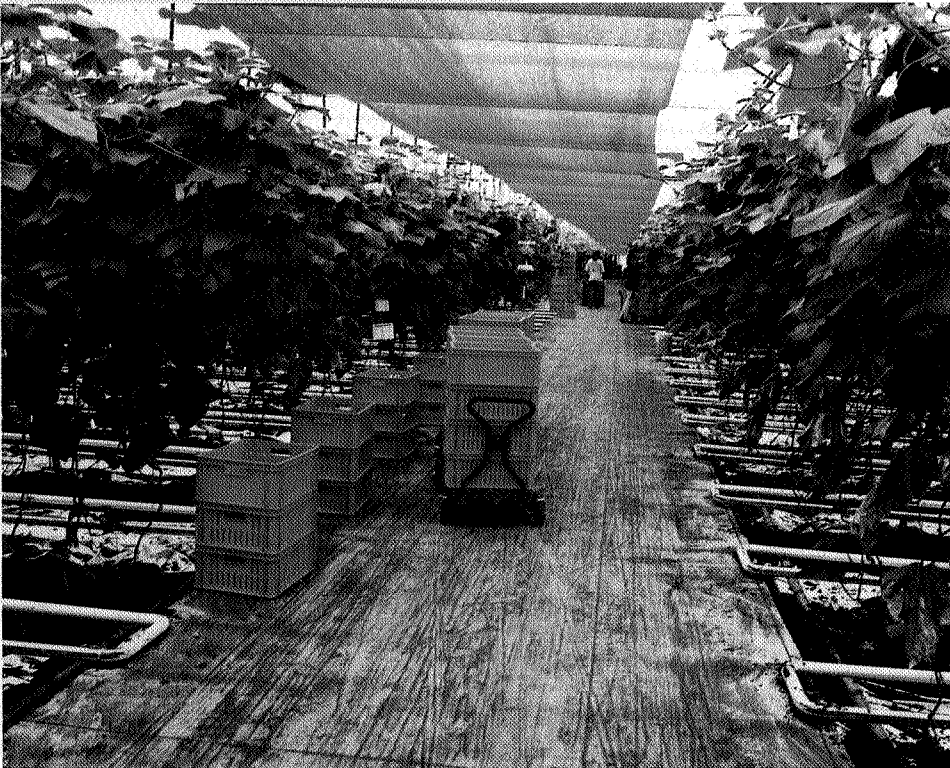
Ook tuinders kunnen met de regeling SDL worden gestimuleerd om duurzaam te produceren

De Regeling Stimulans Duurzame Landbouw (SDL) is met ingang van 1 januari 2001 van kracht geworden. Deze regeling is bestemd voor de ondersteuning van de beoefening van de duurzame landbouw. SDL is dus geen verplichte regeling maar een stimuleringsregeling. De regeling beperkt zich niet tot alleen veehouderijbedrijven, want ook tuin- en akkerbouwbedrijven kunnen met de regeling SDL worden gestimuleerd om duurzaam te produceren. Een belangrijke voorwaarde daarbij is dat bedrijven een certificaat kunnen overleggen waarmee de duurzaamheidseisen zijn geborgd. Voor de veehouderijbedrijven is de regeling SDL te beschouwen als de opvolger van Groen Label.