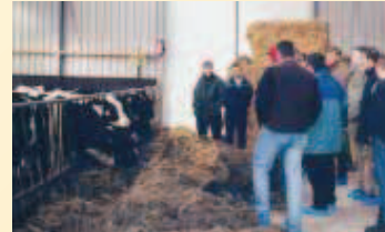
De varkensstal is vervangen door een mooie ruime jongveestal

De voormalige kaasmakerij is inmiddels we verbouwd tot ontvangstruimte, en de varkensschuren zijn gesloopt. Op die plaats