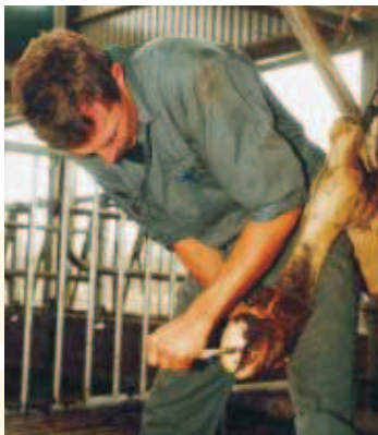
Klauwafwijkingen worden tijdens het bekappen vastgelegd

Vanaf januari 2001 registreren de Koeien & Kansen-deelnemers alle dierziekten, aandoeningen en toegepaste behandelingen. Daarnaast beoordelen DLV-adviseurs regelmatig de conditiescore en pootscore van de dieren. Door deze uniformering kunnen we de Koeien & Kansen-bedrijven binnenkort dus onderling vergelijken voor kengetallen over diergezondheid en vruchtbaarheid. Ook worden vergelijkingen mogelijk met bijvoorbeeld proefbedrijven van het praktijkonderzoek en met de gegevens van praktijkbedrijven in andere projecten.