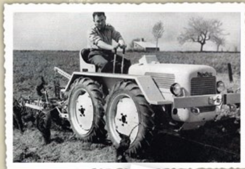
De Minitrac is een wieltrekker op basis van een rupstrekker. Het sturen gebeurt met hendels. De Minitrac is leverbaar met een 22 pk Perkins of een 24 pk Mercedes. De transmissie is een 6+4.

Cruq bezoekt de Salon in Parijs. Die heette toen SMA, ofwel Salon de la Machine Agricole. De I van internationaal zat er nog niet tussen. Dat kon volgens Cruq echter gauw wijzigen, want de Franse markt was in 1958 goed voor ruim 100.000 trekkers. In 1959 produceerde Frankrijk er zelf 80.000, dus er was al import. De grote trekkermerken ontbreken in Parijs, omdat ze niet elk jaar willen komen. Het kleine trekkernieuws waarmee de hoofdredacteur terugkomt naar Wageningen heeft onder andere