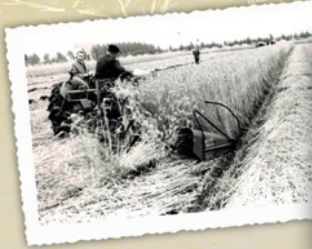
Zwadmaaien wordt in 1959 op ruime schaal toegepast. Het is van belang dat het zwad niet te dik komt te liggen en dat er een haspel wordt gebruikt.