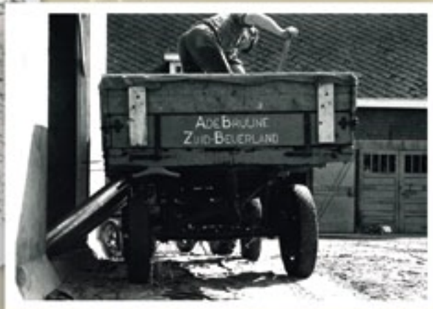
Een eenvoudige wijze om een landbouw-wagen geschikt te maken voor graantransport: twee gaten in de vloer die met schuiven zijn af te sluiten. Bij het lossen worden buizen bevestigd.

betrekking op de Minitrac en de Autoculteur. De Minitrac zouden we nu een 'schrantrekker' noemen, naar analogie van schrankladers à la Bobcat. De Autoculteur is minstens zo bijzonder en kan elk van de drie wielen afzonderlijk in hoogte verstellen. Dat is praktisch op hellingen. De Franse fabrikant De Jouette meldt echter ook dat de Autoculteur met een voldoende zwaar werktuig in de hef te gebruiken is als enkelasser, ofwel tweewieler.