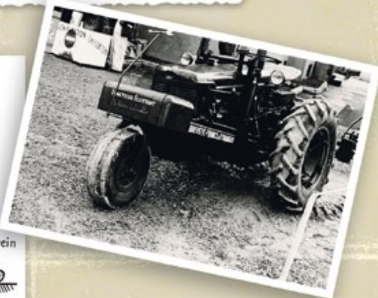
De Autoculteur kan z'n drie wielen onafhankelijk van elkaar in hoogte verstellen; dat is handig bij het werken op hellingen. De basis is een Farmall.

De voorplaat van april 1960 toont volgens de inhoudspagina 'Het einde van de dagtaak op een klein bedrijf'. Gezien de bouwwijze van de schuren stond (of staat) dat kleine bedrijf ergens in de oostelijke Achterhoek of Twente, maar daar zegt de tekst niets over. Wel dat de foto van ir. F. Coolman is. Dat het een klein bedrijf betreft, weet Coolman waarschijnlijk zeker, maar de lezer moet het afleiden uit de grootte van de Farmall. Een tweede trekker hadden boeren toen nog niet, zeker niet op de oostelijke zandgrond.