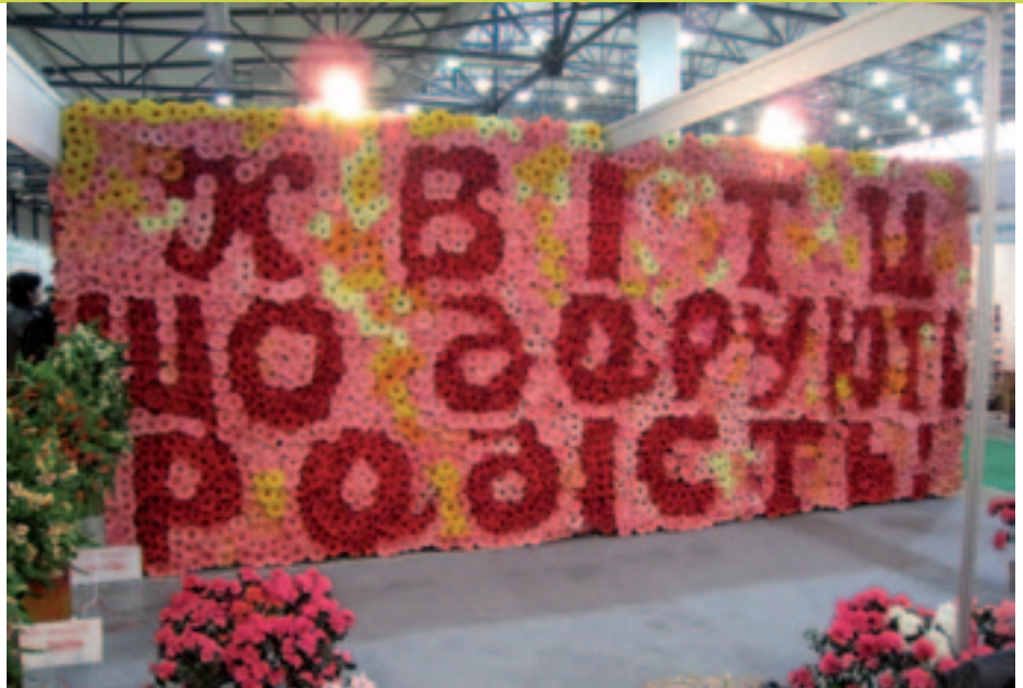
Bezoekers worden kleurrijk welkom geheten.

De distributie over het jaar van binnen(pot)-planten laat eenzelfde beeld zien als die van bloemen en 80% van de binnenlandse