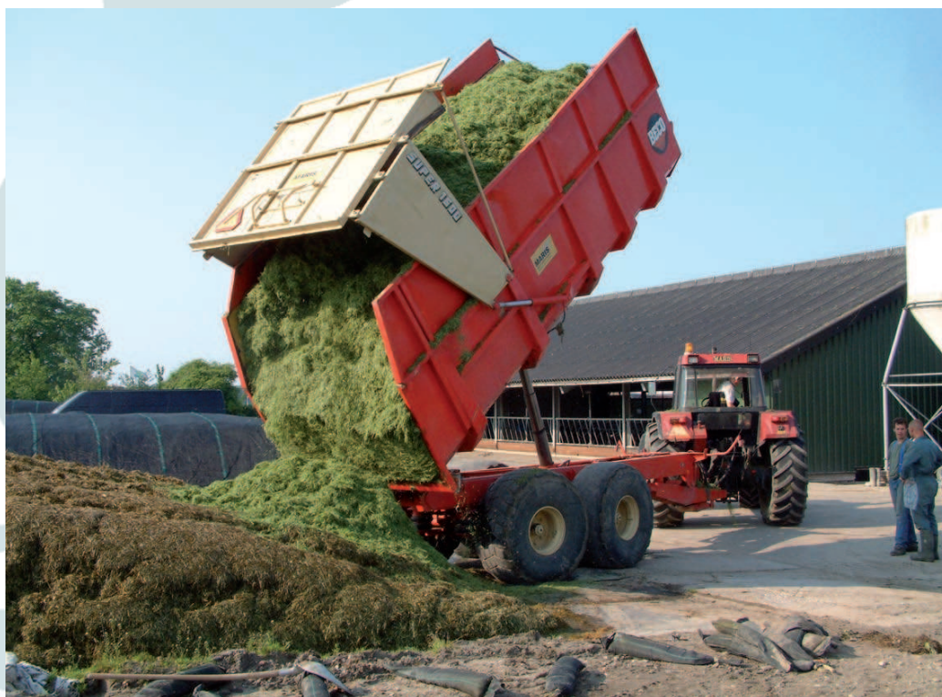
De gewasopbrengst kan gelden als de bedrijfsspecifieke bemestingsnorm.