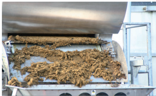
De dikke fractie na mestscheiding bevat relatief veel fosfaat en weinig stikstof.

Moeilijker ligt het met de bemestingsnormen voor stikstof. Omdat de Nitraatrichtlijn de maximale hoeveelheid stikstof als dierlijke mest concreet voorschrijft, heb je ontheffing nodig om daarvan te mogen afwijken. Naast die beperkte hoeveelheid stikstof als dierlijke mest mogen veehouders een (generieke) hoeveelheid kunstmest