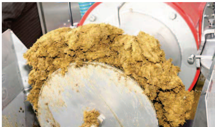
De mestscheider op De Marke levert een mooie, droge, stapelbare dikke fractie.

Bij aangescherpte gebruiksnormen biedt mestscheiding mogelijkheden om de mestafvoer te beperken. Maar de bedrijfsomstandigheden bepalen de voor- en nadelen. Dit concluderen de deelnemers aan een workshop over mestscheiding.