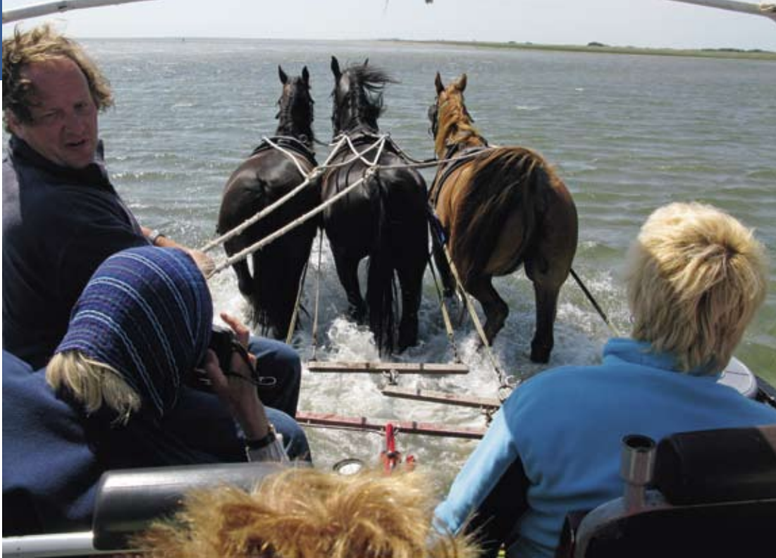
Huifkartocht over de Boschplaat, Terschelling

van de mens zelf impliceert, en van zijn meest kenmerkende levensprocessen, waren Adorno en Horkheimer, die in 1942 het boek Dialektiek van de Verlichting schreven. Ze hadden geen idee van de latere ontwikkelingen, van de uitputting van grondstoffen, van de versnelde vermindering van biodiversiteit door de mens, maar het algemene principe, dat vernuftige beheersing van de natuur op mensen terugslaat, zagen ze wel al werkzaam. Deze gedachte was voor hen zo overweldigend, dat pessimisme onvermijdelijk was. Ze zagen alleen nog maar natuurdestructieve ontwikkelingen en wisten niet van een uitweg. Nu, meer dan zestig jaar later, kunnen we de natuurbeheersing nuchterder bekijken en zien we dat we de teugels van de beheersing ook kunnen vieren, en dat we veel kunnen leren van de manier waarop natuurprocessen zelf gebruik maken van elkaar zonder elkaar uit te putten. Er zijn goede voorbeelden van duurzame omgang met natuurprocessen zonder nadelige gevolgen, zoals de ontwikkeling van nieuwe natuur, het herstel van de natuur in Nederland, zonne-energie en de beëindiging van ozonafbrekende gassen. We moeten daarom alert en kritisch zijn maar er is geen goede reden om te concluderen dat vanwege de enorme vernietiging van de natuur van de afgelopen jaren ook in de toekomst natuur op deze schaal zal worden vernietigd.