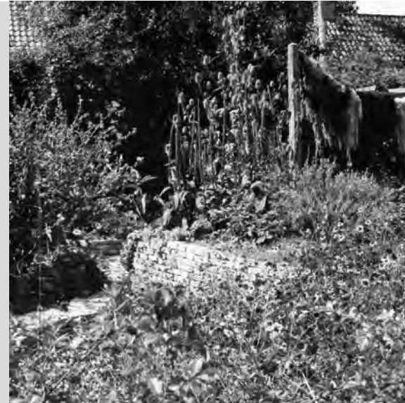
Vitaliteit in de tuin stimuleert de eigen vitaliteit

De vereniging bestaat nu 10 jaar. Wat begon als een groepje pioniers met een passie voor ecologisch groen is nu een vereniging van 170 professionals. Op de site van Wilde Weelde vindt u hierover veel informatie, onder andere de Jubileum-nieuwsbrief met het thema 'Natuurlijk Groen voor de zorg'. Ook is regionaal te zoeken naar iemand bij u in de buurt. Zie www.wildeweelde.org