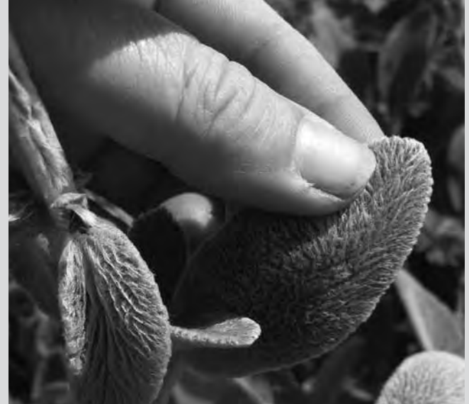
Voor blinde mensen zijn planten waar iets bijzonders aan te voelen of te ruiken is, extra interessant (foto Machteld Klees), zie bijv. het boek Tastbaar Groen .