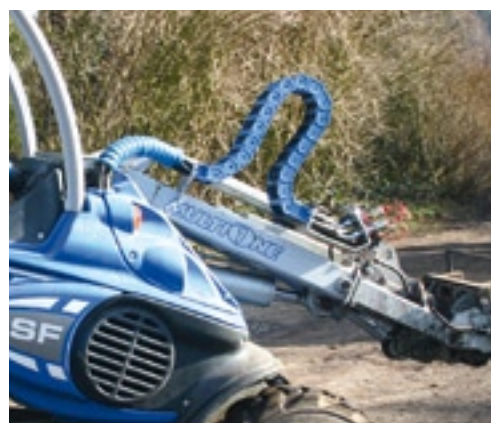
De hydraulische slangen worden met een kabelrups begeleid.

als de arm is ingeschoven en uitgetrokken als de arm is uitgeschoven. Aan het einde van de arm is een (snel)wisselsysteem geplaatst. Deze kun je handmatig bedienen, maar veel gebruikers kiezen toch voor hydraulische bediening met een druk op de knop. ■