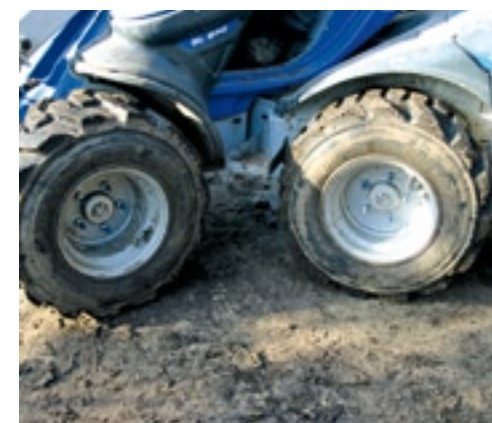
Ondanks dat je kort kunt draaien, is de schade aan de ondergrond (met name op gazons) nihil.