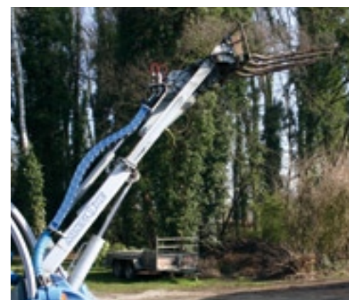
Met uitschoven arm bedraagt de maximale hoogte 3 meter.