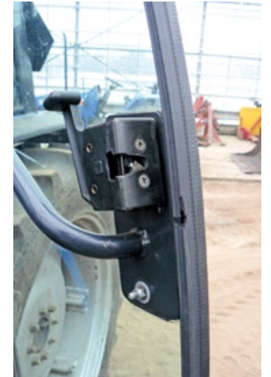
Als alles op je werkplek in de cabine zo goed als mogelijk is ingesteld, werkt het vaak al beter en plezieriger. Ook voorkom je overbodige rammels en geluiden door losse delen vast te zetten, zoals deursloten.