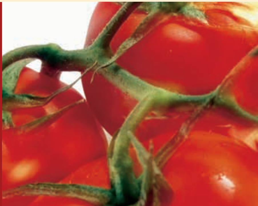
Een plant moet de voeding krijgen, die u wilt geven.

Veel ondernemers vinden de bemesting een moeilijk onderdeel van hun bedrijfsvoering. Daarom baseren veel tuinders zich blindelings op het bemestingadvies of op de adviezen van hun teeltbegeleider. Het is niet erg als een teler zich laat adviseren, maar een goede ondernemer moet zelf wel de hoofdlijnen kennen en deze in de gaten houden. Daarom start "Onder glas" in dit nummer met een serie artikelen over bemesting. De artikelen worden geschreven door Yara Benelux en door Blgg-Naaldwijk.