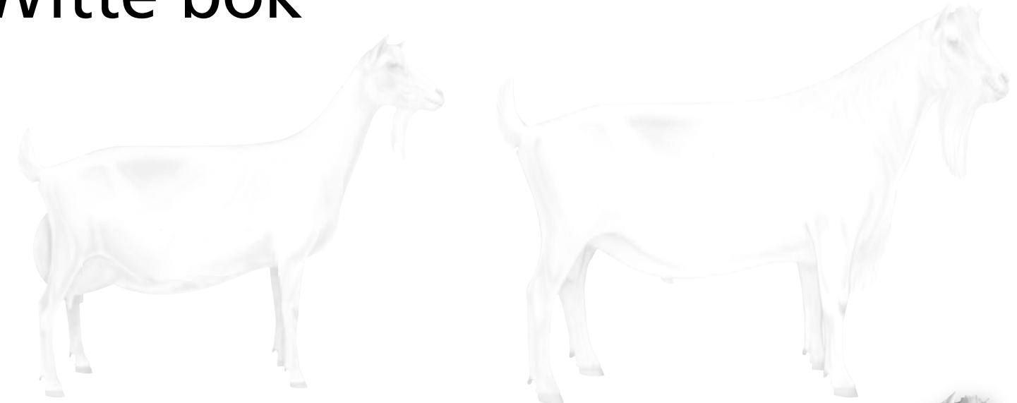
Links Witte geit en rechts Witte bok.

De Nederlandse Organisatie voor de Geitenfokkerij (NOG) heeft in samenspraak met de fokcommissies van elk geitenras een True Type tekening laten maken. Het True Type is het beeld van de geit of bok dat een fokker voor ogen dient te hebben. In deze Geitenhouderij treden de Witte geit en bok voor het voetlicht.