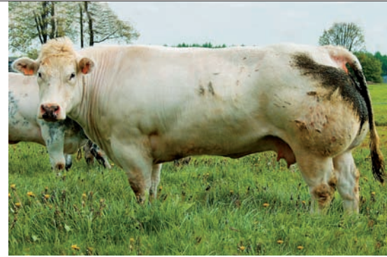
Moeder Captive de l'Hez Kernai (v. Notez-Le) is nog steeds fokactief

L'Hez Kernai. Het fokkerijsuffix kent vele varianten in de uitspraak. De bijzon-