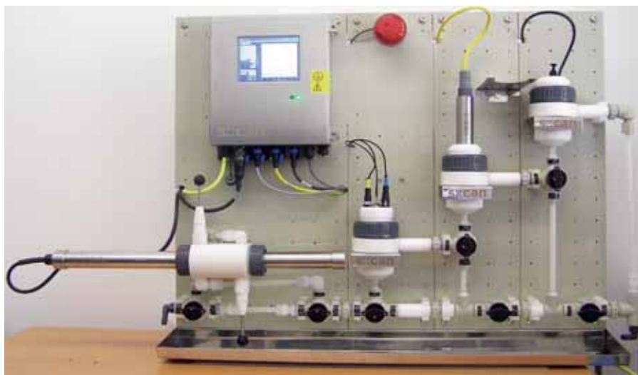
Multi-sensorplatform voor online monitoring van de waterkwaliteit.

Samenwerking in drinkwateronderzoek op Europees niveau loont, zo luidt de conclusie van de deelnemers aan de tweede jaarlijkse bijeenkomst van TECHNEAU in Trondheim (Noorwegen). Onderzoekers presenteerden daar onlangs de voortgang van het programma en stelden het werkplan voor de komende 18 maanden vast. Het consortium heeft op verschillende terreinen vorderingen gemaakt. Doorbraken zijn te melden voor de online, in situ monitoring van de waterkwaliteit en voor biologische detectiesystemen voor hormoonverstorende stoffen. Verder laat onderzoek zien dat nog veel winst valt te behalen door optimalisatie van bestaande drinkwatersystemen.