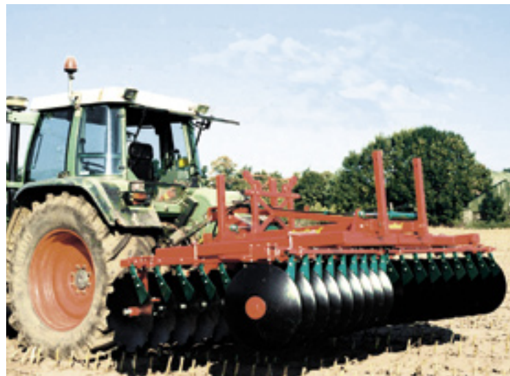
▲ Bij Goudland is de ophanging van de schijven aan een centrale as. De GSH34 heeft 34 schijven, een werkbreedte van 310 cm, een gewicht 610 kg en hij vraagt een trekker van 55 kW.

ophanging van de schijven is. Zo hangen Amazone, Evers en Lemken ze onafhankelijk op. Iedere schijf volgt dan de bodem. En als je er eentje moet vervangen, haal je hem ertussenuit.