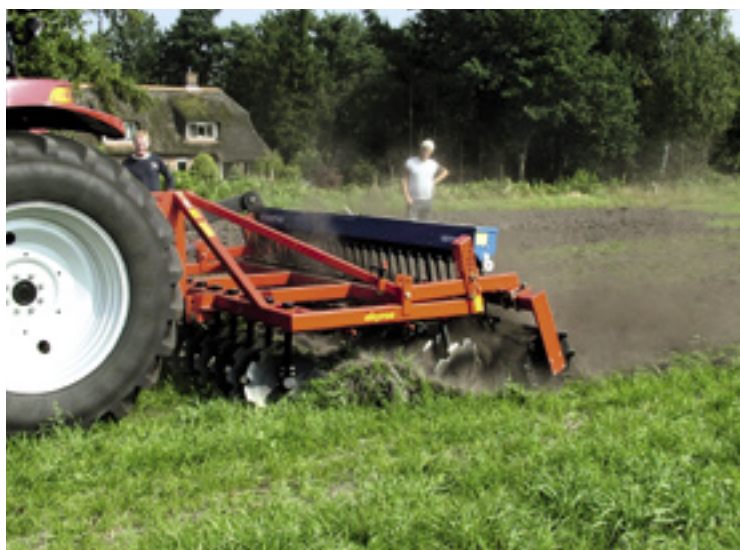
▲ De 3 meter brede Evers Skyros V300 schijveneg heeft 24 schijven die onafhankelijk zijn opgehangen. Dit werktuig vraagt een trekker van 52-85 kW.