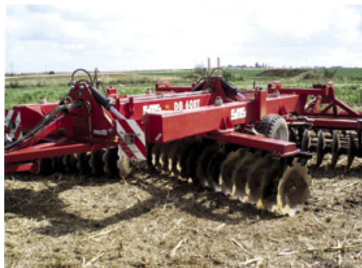
▲ De semi-gedragen SMS DB400-P werkt 4 meter breed en heeft 32 schijven. Deze weegt 3.640 kg en vraagt een trekker tussen de 100 en 120 kW.