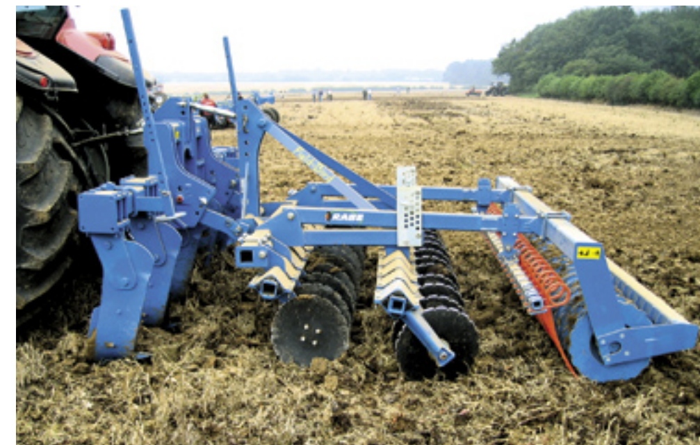
▲ Door een schijveneg te combineren met een woeler is in één werkgang de stoppel te bewerken en zijn vastgereden plekken diep los te trekken.

Net als bij de cultivator kun je de woeler voorzien van passend schoeisel. Je kunt gebruik maken van smalle beitels, maar ook van brede ganzenvoeten. De diepteregeling gebeurt met een rol of (in een enkel geval) met dieptewielen.