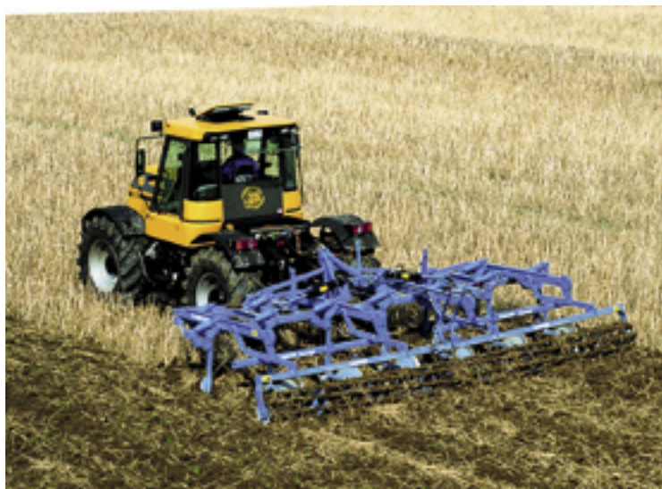
▲ De Lemken Smaragd 9 is 4 meter breed. Hij heeft negen tanden en de acht schijven zijn afzonderlijk opgehangen. Voor het 970 kg zware werktuig is minstens een 132 kW trekker nodig.