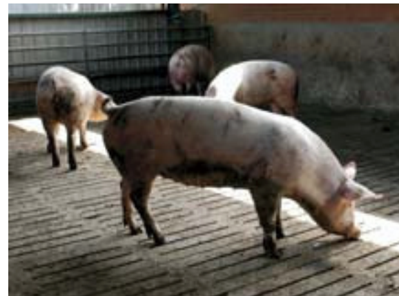
In de komende jaren trekt de overheid veel geld uit voor de reconstructie in gebieden met veel intensieve veehouderij

noteerde deze provincie zeven maal de hoogste agrarische nieuwbouwproductie. Vergeleken met de eenzijdige samenstelling van Zuid-Holland, is de Noord-Brabantse verdeling over de verschillende subsectoren evenwichtiger verdeeld.