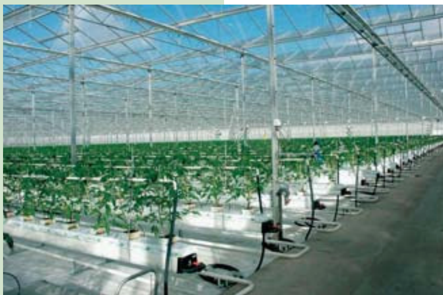
De bouwbehoefte neemt toe door de herstructurering van de glastuinbouw

De onrustige periode 2001-2003, gekenmerkt door besmettelijke dierziekten en een economische recessie, is voorlopig achter de rug. Hoewel met het dichterbij komen van de vogelgriep de angst voor besmetting in Nederland is toegenomen, was de afgelopen periode 2004-2005 voor de agrarische sector relatief rustig. Mede door een topogst aan akkerbouwgewassen steeg over 2004 het totale productievolume van de landbouw met ongeveer 3 procent. Ook in de eerste twee kwartalen van 2005 bleef de productie op een hoog niveau. Vanaf medio 2004 zijn investeringen in vaste activa door landbouwbedrijven toegenomen. Het zijn deels investeringen in gebouwen. 1 Een belangrijk deel van de hogere landbouwproductie is terug te voeren op de gestegen export. In 2004 nam de export van landbouwproducten met 4,6 procent toe tot een volume van € 11,5 miljard. Het aandeel in de totale export van