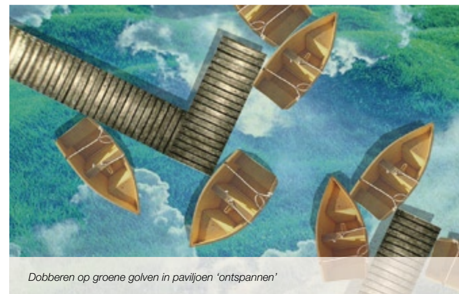
Dobberen op groene golven in paviljoen 'ontspannen'