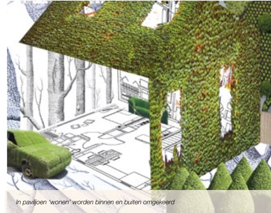
In paviljoen 'wonen' worden binnen en buiten omgekeerd