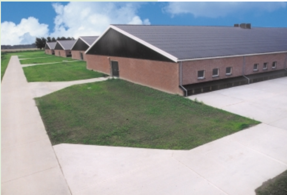
Praktijkonderzoek veehouderij is een onderdeel van Wageningen UR

Binnen Wageningen UR wordt zowel fundamenteel als toegepast onderzoek uitgevoerd door een aantal hooggekwalificeerde onderzoeksinstituten (voorheen de Dienst Landbouwkundig Onderzoek, DLO), departementen van Wageningen Universiteit en onderzoekcentra. Postdoctorale opleidingen die aan Wageningen verbonden zijn bundelen de krachten van verschillende onderzoekswerkgroepen van Nederlandse universiteiten en instituten. De behoefte om efficiënter gebruik te maken van deze onderzoeksfaciliteiten leidde tot de formatie van verschillende gezamenlijke expertisecentra en programma's.