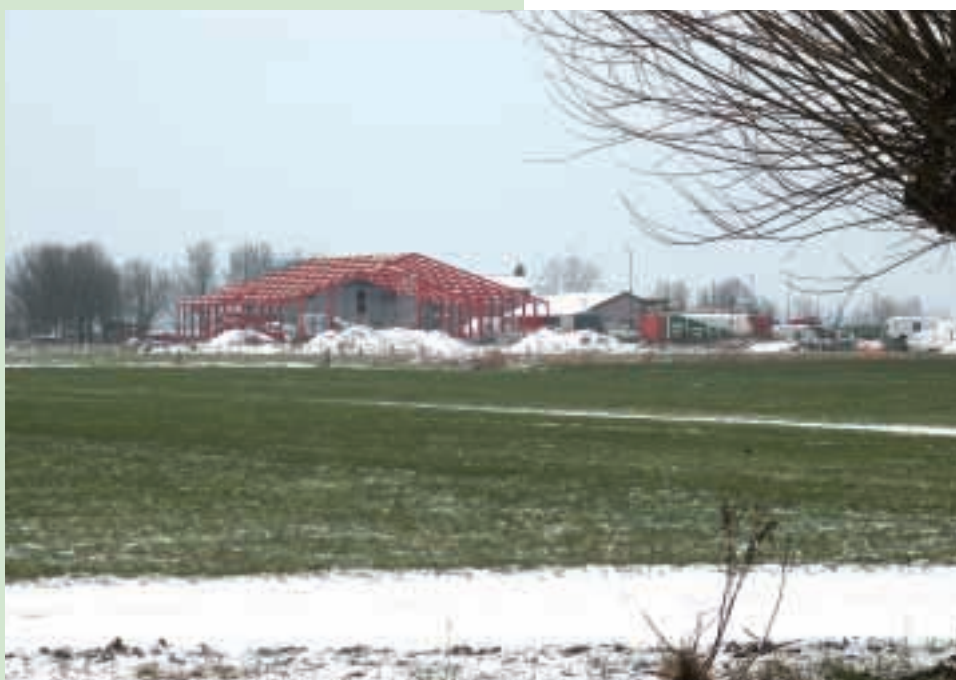
Stallenbouw bepaalt voor een groot deel de agrarische bouwproductie

De agrarische sector is opgebouwd uit de landbouw, de bosbouw en de visserij. De bouwproductie voor de agrarische sector is de som van alle bouwactiviteiten voor deze subsectoren. Visserij en bosbouw bepalen minder dan één procent van de agrarische bouwproductie. Het grootste gedeelte van de agrarische utiliteitsbouw is dus bestemd voor de landbouw.