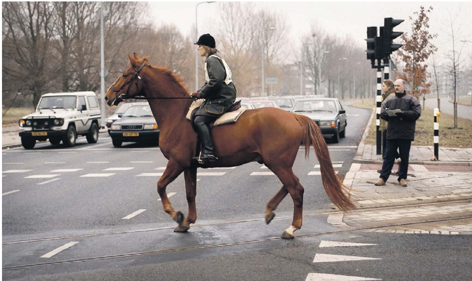
Een ruiter op de weg wordt vaak verkeerd benaderd door chauffeurs.