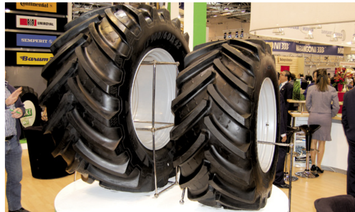
▲ BKT Agri Maxforce IF 710/60R34 en de IF 900/60R42.