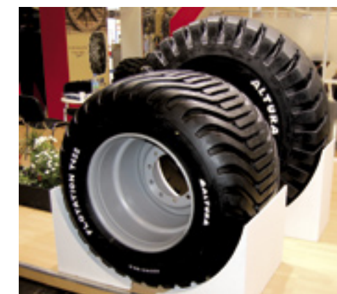
▲ Altura de Flotation T 422.