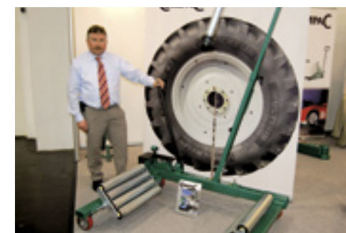
▲ Compac wielheffer.