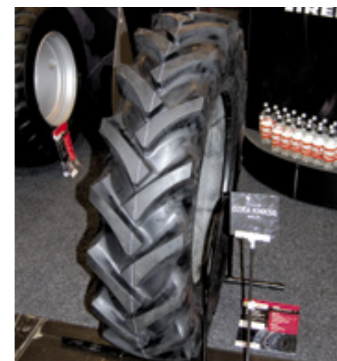
▲ Ozka diagonaal band.