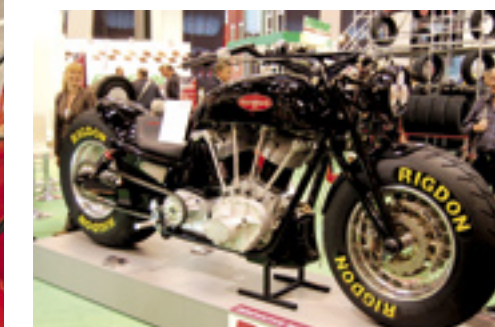
▲ Grootste motorfiets.