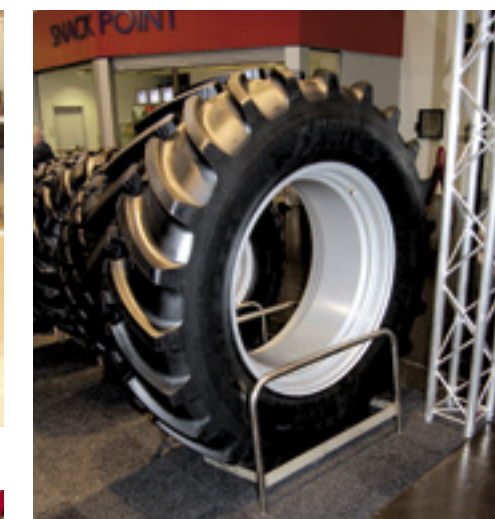
▲ Mitas RD-03 650/65 R38.