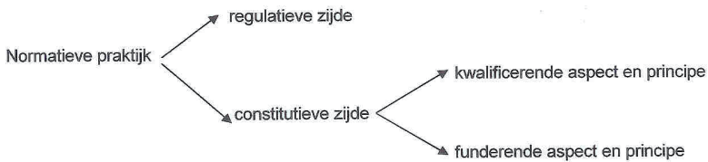
..... Figuur 1: De normatieve structuur van een sociale praktijk.

Dit geldt wel in het bijzonder van de praktijk(en) van het internationale ontwikkelingswerk die in de moderne vorm nog relatief jong is en voortdurend ook zelf in ontwikkeling. Deze praktijk is zeker nog niet uitgekristalliseerd zoals de diverse andere genoemde praktijken. Dit temeer daar deze praktijk vanaf haar begin, kort na de tweede wereldoorlog sterk gestempeld is door de moderniteit, zoals uiteengezet, en meer en meer duidelijk wordt dat die visie tekort schiet. De normativiteit van het ontwikkelingswerk zelf zoals dat door professionals uitgevoerd wordt, dringt zich op en stuit op de weerbarstigheid van de feitelijke gang van zaken (zie paragraaf over deugden aan het einde van dit betoeg).