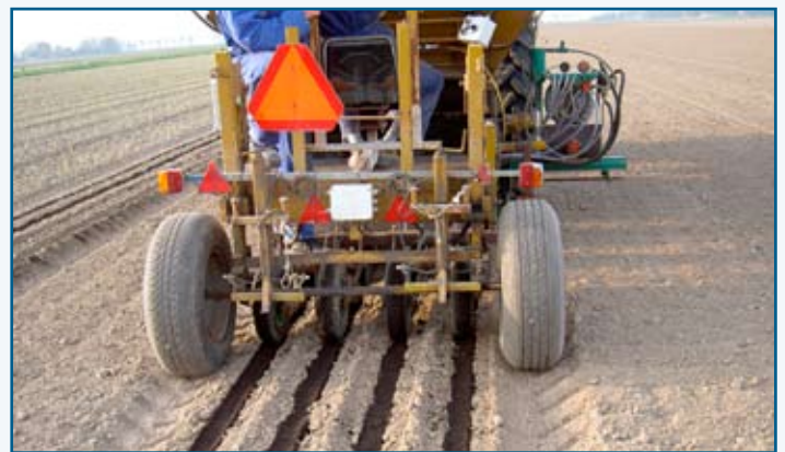
Het prototype in actie ...

De basis van het prototype is een lelieplanter. Deze machine is in staat een goede egale verdeling te verzorgen. De plantpijpen zijn vervangen door pijpen die de zwarte grond ongestoord op de grond laat vallen. Onderaan het prototype is een precisie-