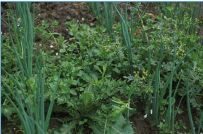
Dit had voorkomen kunnen worden ...

Onkruidkieming voorkomen door het aanbrengen van een laagje zwarte grond (compost) op het pas gezaaide zaad.