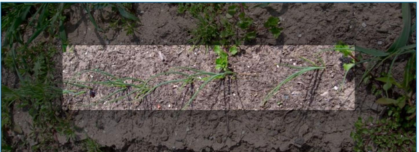
Effect van het afdekken met zwarte grond ...

Het systeem is toepasbaar in gewassen die in rijen gezaaid worden en waar de afstand in de rij klein is. Voorbeelden hiervan zijn zaauien en wortelen, maar ook diverse kruiden en prei (opkweek).