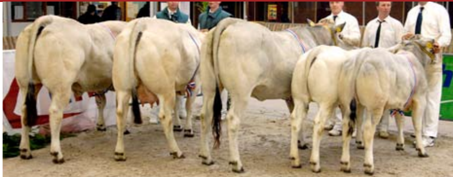
De Piemontesekampioenen: Elza 7, Norma 22, Rosa, Norma 24 en Bilcob