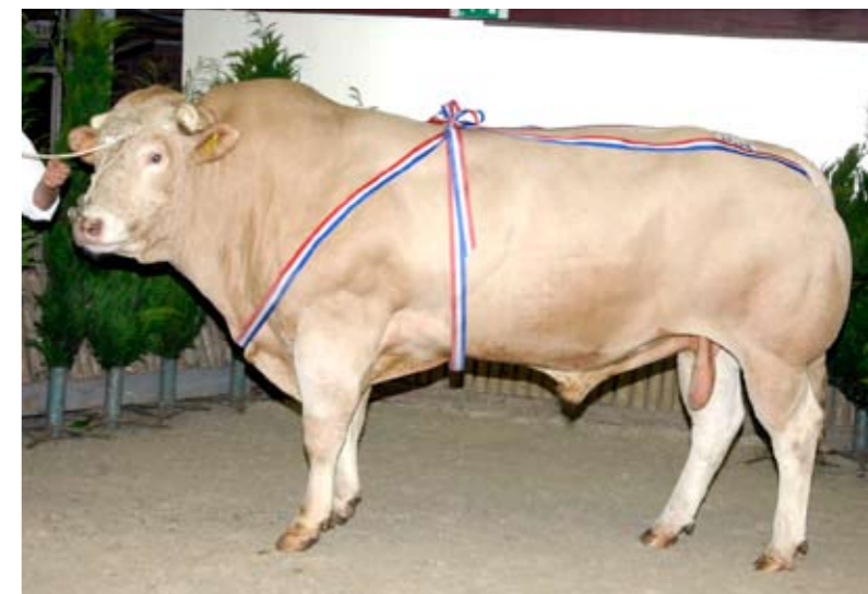
Ulmínio (v. Nickel) van De Zandhoeve Spaansens Holding uit Winkel, kampioen mannelijk 3 jaar en ouder

bruikte benen deden haar voor de zoveelste keer op rij winnen. 'Ze heeft altijd de eerste plaats op de keuring gehaald', lichtte Hans Spekenbrink toe.