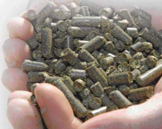
Grasbrok persen sterk afhankelijk van afstand tot drogerij

Gras is er op de meeste bedrijven meer dan genoeg. Welke mogelijkheden heb je als veehouder om uit gras zelf krachtvoer te telen? De optie om grasbrok te persen van overtollig gras is vooral afhankelijk van de afstand van het bedrijf naar de dichtstbijzijnde grasdrogerij, geeft Van Schooten aan. 'Is er een drogerij in de buurt? Dat is voor bedrijven de beperkende factor.'