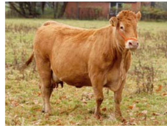
Marieke, 85 punten fraai

structuurballen en graspallets. 'Een prima krachtvoerbron voor bioveehouders', weet de veehouder over de graspallets te vertellen. 'Een vem-waarde van 850 tot 950 en, afhankelijk van het maaitijdstip, een ruweiwitgehalte tussen de vijftien en twintig procent. In de meeste jaren valt er genoeg gras te winnen en kunnen we ook structuurballen en grasbrot verkopen.' Het koeienkoppel van het limousin mixte type telt 150 moederdieren op een totaal van 450 stuks vee. De koeien kalven af van oktober tot december en van maart tot juni. De koeien uit de eerste groep worden allemaal bevrucht via ki, die uit de tweede groep via dekstieren. Voor het ki-vaderschap in 2006-2007 tekenden onder meer Mas du Clo, Omer, André LCO Navarin en Pacha. Van de stierkalveren uit ki worden er twintig aangehouden voor de eigen fokkerij of voor de verkoop als fokvee. De overige stiertjes worden af-