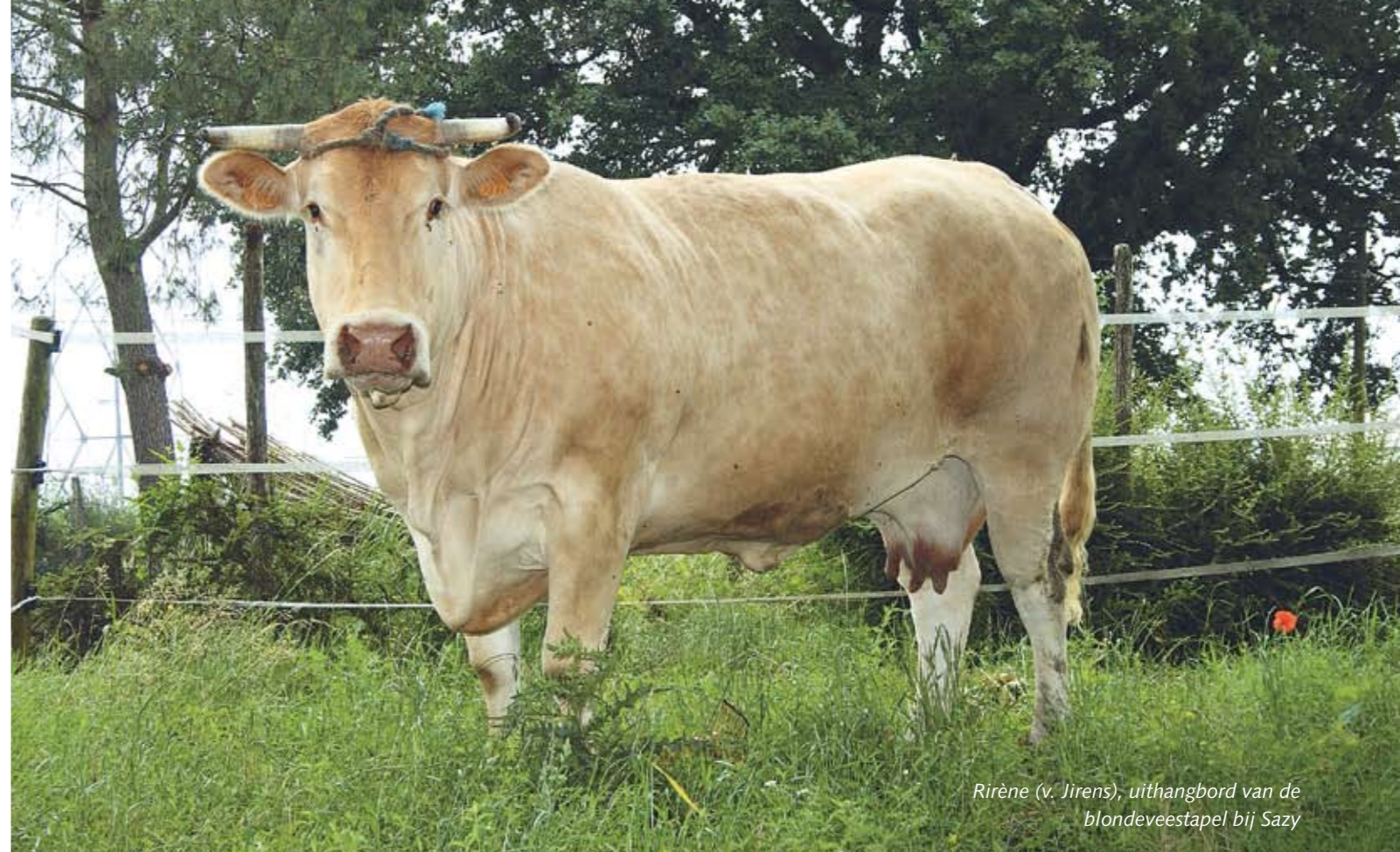
Rirène (v. Jirens), uithangbord van de blondeveestapel bij Sazy

Sazy houdt een geheel eigen fokkerijlijn aan op zijn bedrijf en maakt rijkelijk gebruik van zelfgefokte stieren. 'Op het niveau van de ki-fokstieren is in mijn ogen te veel naar vroegrijpheid gezocht. Dat staat bijna haaks op mijn fokkerijdoel van maat en gewicht.' Sinds de start van het bedrijf, ruim vijftien jaar geleden, won deze Franse blondeveestapel gemiddeld tweehonderd kilo aan karkasgewicht. 'Maar ook dat laatste moet je beperken. Ik kan niet op de grootste dieren en het zwaar-